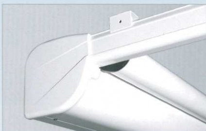
Der kompakte und formschöne Markisenkasten bietet optimalen Schutz für das Tuch

Als Bespannung für die T100 kommen wahlweise Tücher aus Acryl oder SOLTIS-Screen zum Einsatz. Ob die Markisenbespannung dabei farblich eher dezent im Hintergrund bleibt oder ob sie als bunter Farbtupfer in Erscheinung treten soll, in der umfangreichen und geschmackvollen VARISOL Tuchkollektion ist für jede Terrasse das passende Dessin zu finden.