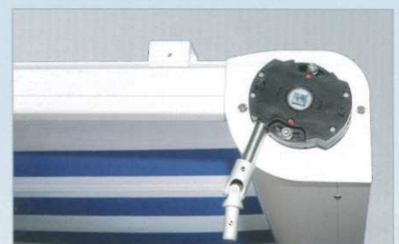
Kurbelbedienung als Option möglich